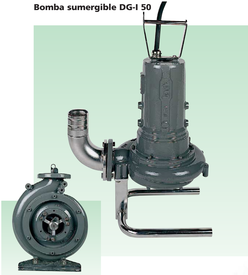
Bomba sumergible DG-I 50

Las bombas LANDIA traen la solución óptima para triturar et bombear los residuos muy cargados con cantidad importante de objetos sólidos. El sistema triturador unico impide los atascos dela bomba y la canalización.